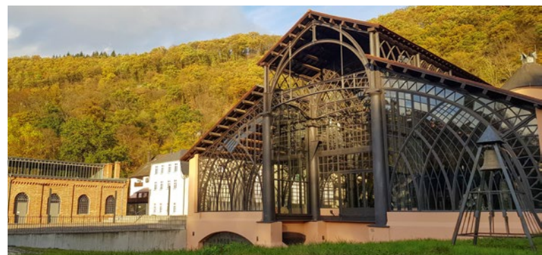
Sayner Hütte Gießhalle Westfassade.

In den letzten Jahren konnte mit Förderungen des Bundes, des Landes Rheinland-Pfalz und weiterer Institutionen eine intensive Phase der Sanierung und Neuausrichtung von Teilen des Denkmalareals und der Gebäude erreicht werden.