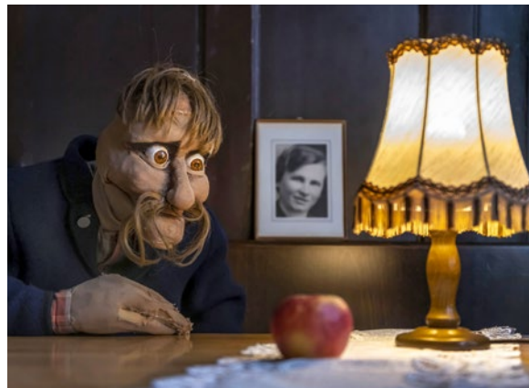
Compagnie MaRRAM, Mainz: Herr Gerber will heim

Moses wächst alleine auf, da sein Vater den ganzen Tag in der Arbeit ist und die Mutter die Familie bereits kurz nach Moses' Geburt verlassen hat. In dem heruntergekommenen Viertel wendet sich Moses auf der Suche nach Liebe und Anerkennung Prostituierten zu. Um diese bezahlen zu können,