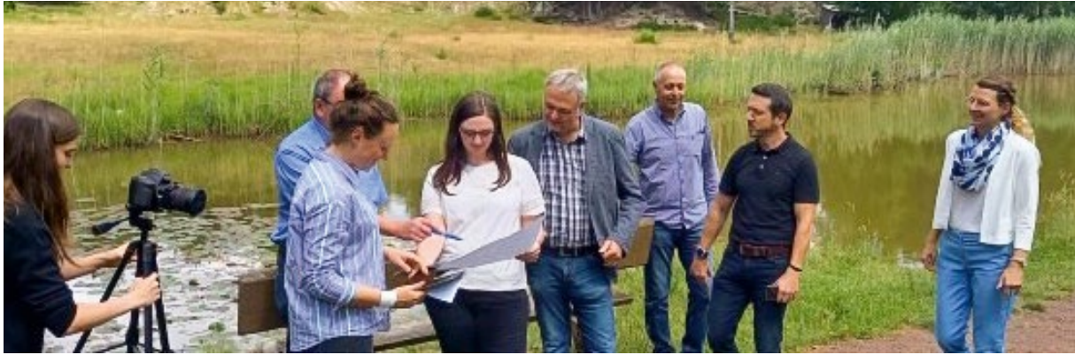
Das Projektteam Eisenberg mit Studierenden bei der Besichtigung und medialen Dokumentation.

orten. Die ausgewählten digitalisierten Objekte lassen sich übergeordneten regionalspezifischen Themen unterordnen, die in einem multimediale Storytelling entfaltet werden.