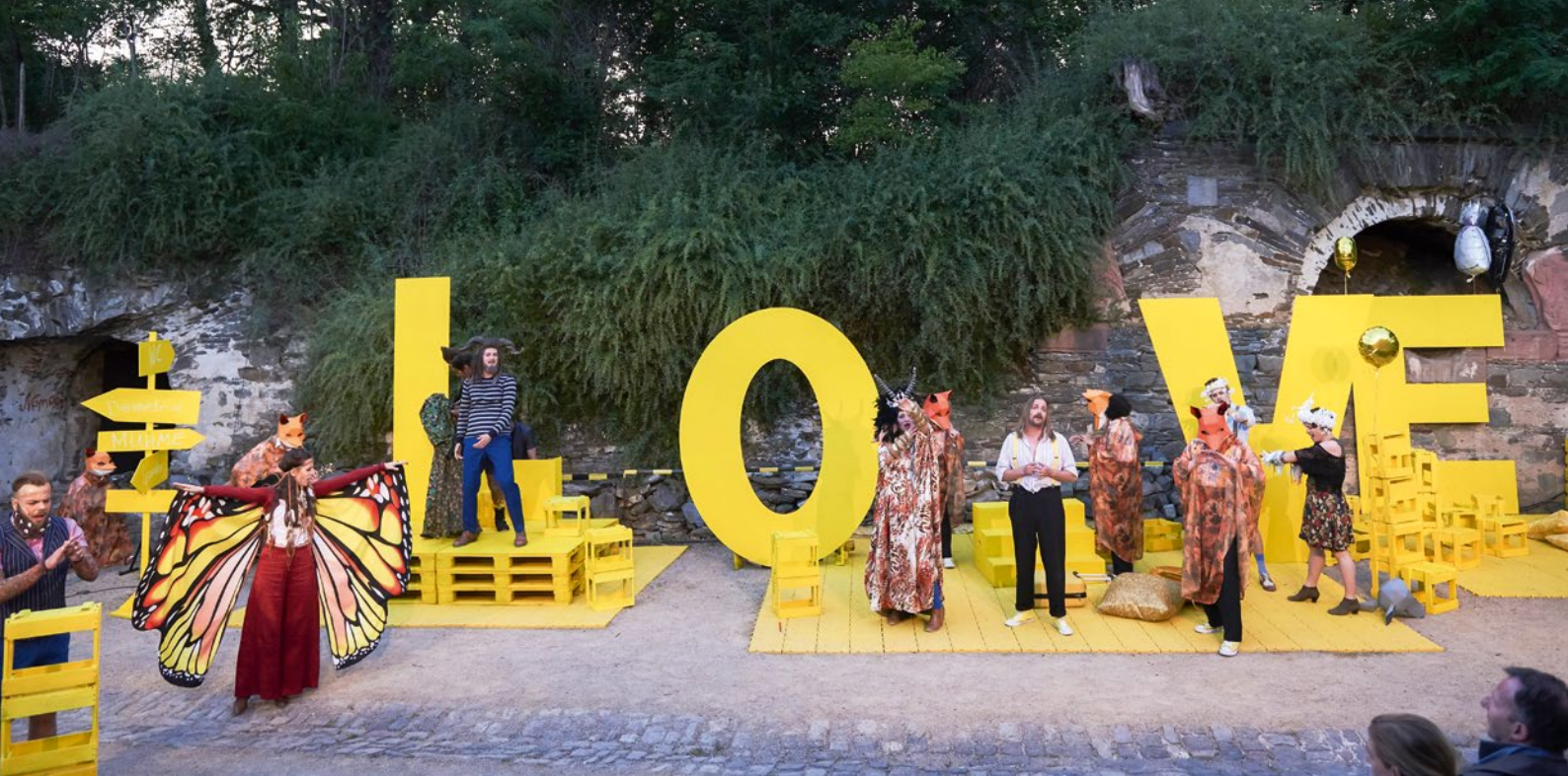
„Shakespeare – Liebe, Tod & Traum“.

Puppentheater des Theaters Koblenz mit „Ein Schaf fürs Leben“, Jugendstücke, sowie Mozarts Oper „Die Entführung aus dem Serail“, inszeniert als Kinderoper.