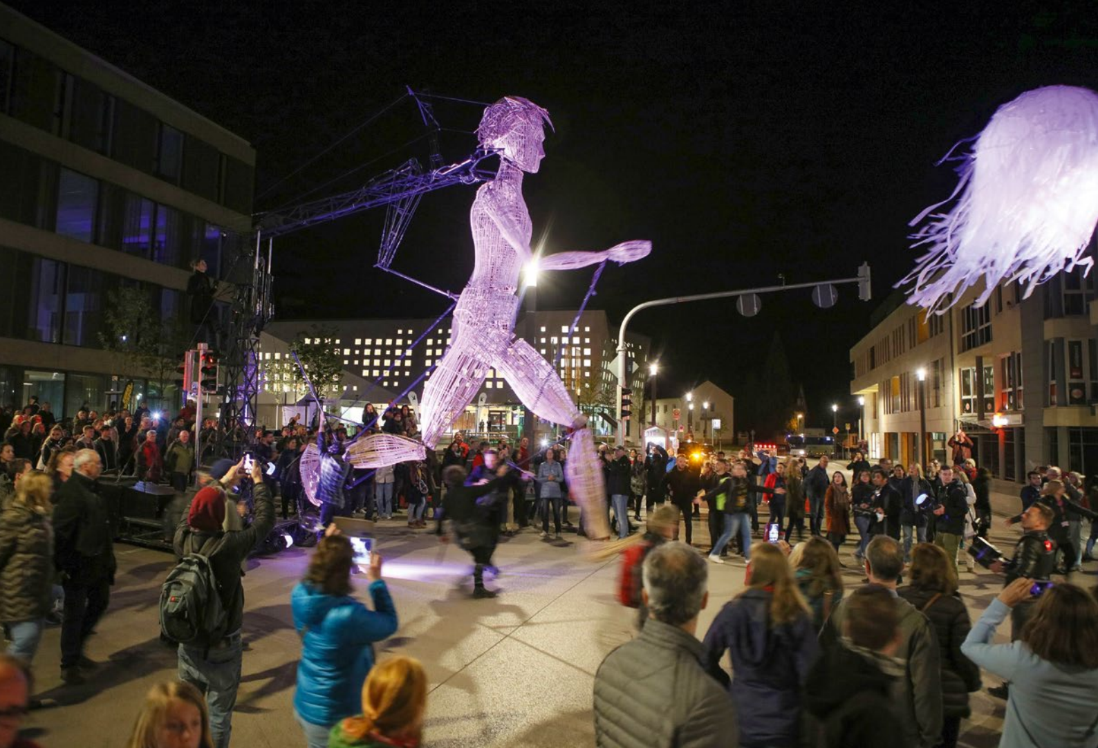
Eröffnung Kultursommer 2019