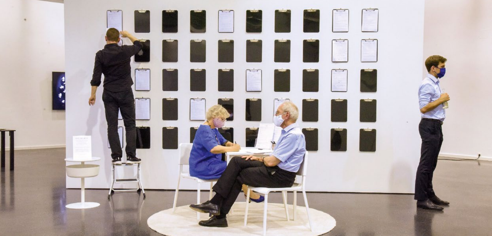
Junge Rheinland-Pfälzer Künstlerinnen und Künstler – Emy-Roeder-Preis 2020. Foto: Ausstellungsansichten © Toni Montana Studios

2020 wurden von den insgesamt 56 Bewerbungen 16 Künstlerinnen und Künstler – 13 weibliche und drei männliche – ausgewählt, die gleichsam alle Medien – Malerei, Skulptur, Grafik, Fotografie, Video, Installation und Performance – repräsentativ vertreten. Es sind wie immer äußerst vielversprechende Positionen junger Nachwuchstalente zu entdecken, die es weiterhin zu fördern gilt.