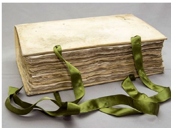
Ratsprotokolle Stadtarchiv Linz

2020 wurden insgesamt 22 Einrichtungen, darunter 14 Archive, 5 Bibliotheken und 3 Museen beim Erhalt des schriftlichen Kulturguts unterstützt. Dabei ging es nicht nur um die Restaurierung historischer Bücher oder Archivalien, sondern vor allem um konservatorische Maßnahmen, z.B. fachgerechte alterungsbeständige Verpackungen oder die Reinigung von Beständen. Auch großformatige Bände und Mappen des 18. Jhd. der Museumsbibliothek des Gutenberg-Museums wurden mit Hilfe der Landesförderung durch alterungsbeständige Verpackungen langfristig geschützt. In der Bibliothek des Bischöflichen Priesterseminars Trier wurde die Aufbewahrungssituation von Kleinschriften zum Bistum Trier durch die Beschaffung und Umbettung in geeignete Stehsammler aus alterungsbeständigem Karton mit Landesmitteln nachhaltig unterstützt.