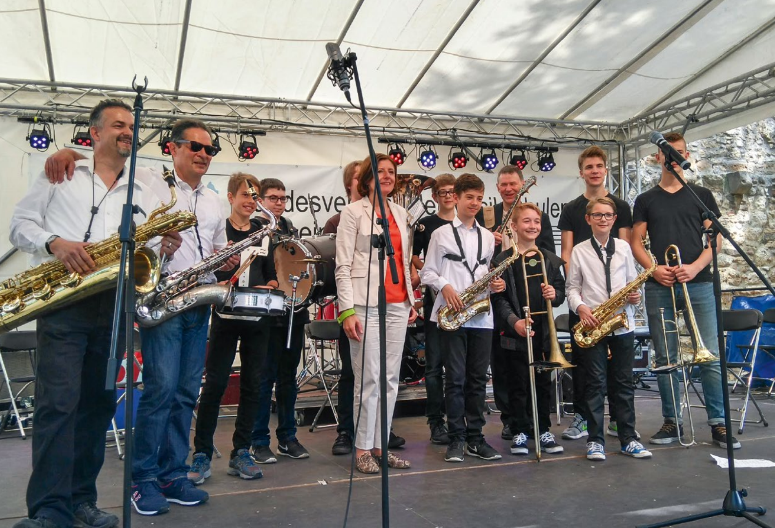
Bläser-Ensemble der Musikschule Speyer beim Rheinland-Pfalz-Tag mit der Ministerpräsidentin Malu Dreyer.

werb mit 60 Teilnehmenden durchgeführt. Das Abschlusskonzert der Preisträger fand im Rokoko-saal des Kurfürstlichen Palais in Trier erstmals länderübergreifend statt. Ebenso wurde länderübergreifend ein Seminar zum Thema „Musiker-gesundheit“ durchgeführt.