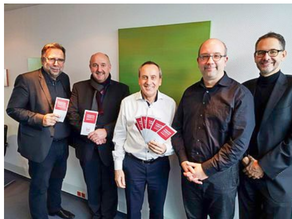
Kulturminister Konrad Wolf (Mitte) mit den rheinland-pfälzischen Theaterintendanten (v.l.n.r Manfred Langner/Trier, Urs Häberli/Kaiserslautern, Markus Dietzel/Koblenz, Markus Müller/Mainz).

Vom 1. bis zum 7. März fanden im Pfalztheater Kaiserslautern die ersten Theatertage Rheinland-Pfalz statt. Mit dem Pfalztheater Kaiserslautern, den Theatern Koblenz und Trier und dem Staatstheater Mainz gibt es in Rheinland-Pfalz vier