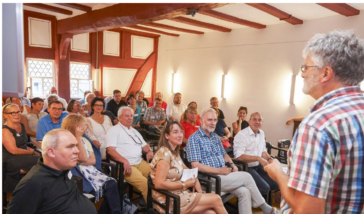
Zukunftsworkshop Hachenburg.

2019 hat die Stiftung Rheinland-Pfalz für Kultur 29 Stipendien mit rund 190.000 Euro und in 2020 insgesamt 27 Stipendien mit einem Volumen von rund 128.000 Euro gefördert.