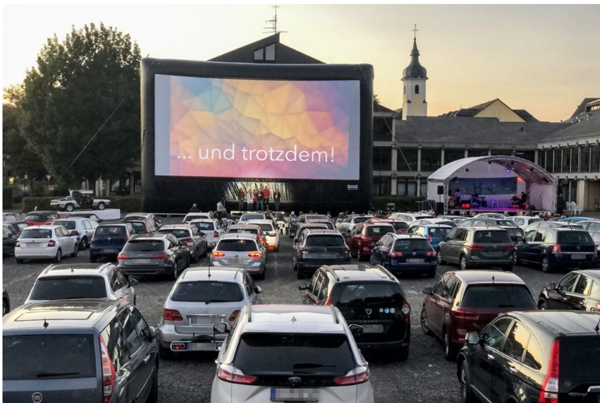
Heimat-Europa Filmfestspiele, Simmern.

oder auch die teilweise oder vollständige Digitalisierung der Kulturangebote: Dadurch konnten fast 2/3 der Projekte realisiert werden. Die Kulturszene hat schnell reagiert und Alternativen gefunden, so dass durch freigewordene Mittel alleine der Kultursommer 35 zusätzliche Projekte fördern konnte. 40 Projekte erhielten Mittel des Kultursommers trotz Ausfall der Veranstaltung oder Verschiebung ins Folgejahr, 122 Projekte haben stattgefunden: Zunächst rein digital, dann die geplanten Ausstellungen, „Live im Autokino“-Projekte ab Mitte Mai, denen ab Mitte Juni auch wieder Indoor- und Open-Air-Veranstaltungen folgten. Die zweiten „Heimat-Europa Filmfestspiele“ in Simmern fanden als Autokinofestival und Open Air statt.