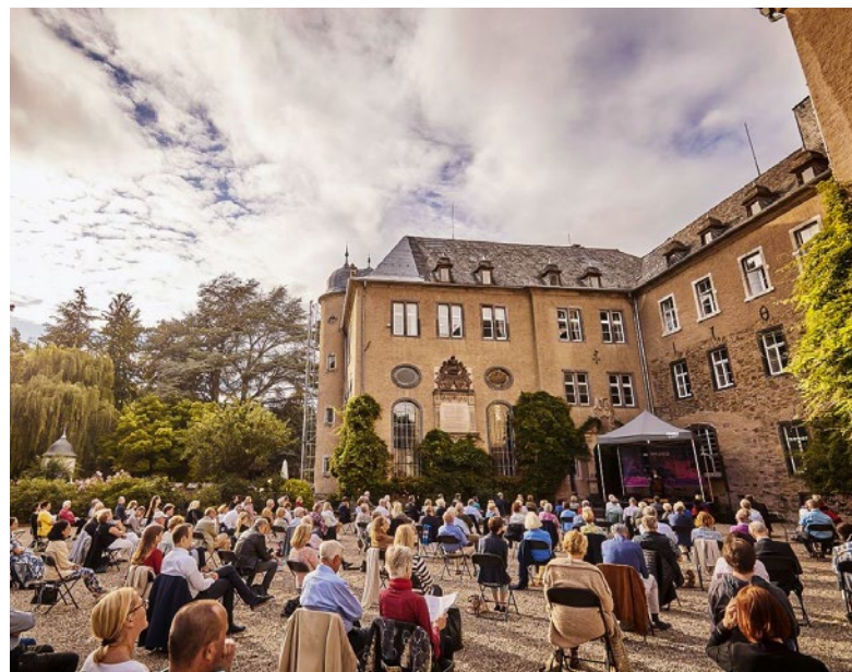
IMUKO Konzert Schloss Burg Namedy, Burghof.

Darunter befanden sich sowohl Förderungen in Höhe von 5.000 Euro als auch große Förderungen mit sechsstelligen Beträgen. Einige Beispiele dafür sind: die Nibelungenfestspiele Worms, das erste „Heimattfilmfestival“ in Simmern, Opening Trier, der Theatersommer Idar-Oberstein, das Theaterfestival „An den Ufern der Poesie“ im Mittelrheintal, die Festspiele Ludwigshafen, das Open Ohr Mainz, die Oraniensteiner Konzerte, Bingen Swingt, Summer in the City in Mainz, das grenzüberschreitende Musikfestival Euroclassic in der Westpfalz, die Internationalen Musiktage Dom zu Speyer, das Festival „Tatort Eifel“, die Mattheiser Sommerakademie Bad Sobernheim, das Weltmusikfestival „Horizonte“ und das „Int. Gitarfestival Koblenz“, die Burgfestspiele Mayen, das Mosel Musikfestival, das Eifel Literaturfestival oder die Illuminale Trier.