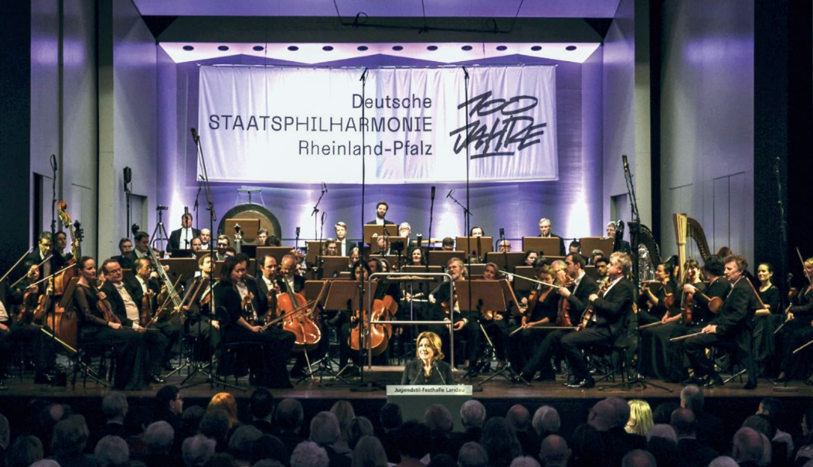
Festrede der Ministerpräsidentin Malu Dreyer anlässlich der Feierlichkeiten zum 100-jährigen Bestehen der Deutschen Staatsphilharmonie Rheinland-Pfalz.

Das Jubiläumsjahr 2019 gab Anlass zu Rückschau und auch zum Blick in die Zukunft. Um den Anforderungen unserer Zeit gewachsen zu sein, startete das Orchester zum 100-jährigen Jubiläum den Strategie- und Digitalisierungsprozesses „Zukunft der Deutschen Staatsphilharmonie Rheinland-Pfalz“, im Rahmen dessen beispielweise eine „Augmented Reality-App“ für einen barrierefreien Zugang zu Konzertinformationen in Form von Teaser-Videos entwickelt wurde.