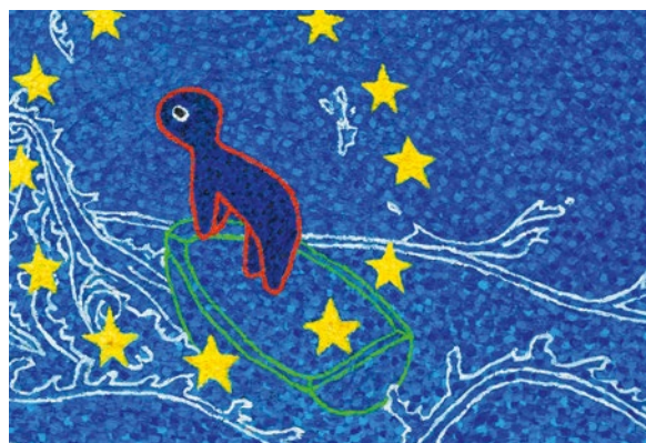
Visegrad4-Schatzbild © Stefan Budian

Vor diesem Hintergrund unterstützt das Kulturministerium jedes Jahr Maßnahmen grenzüberschreitender Kulturarbeit. In 2019 und 2020 konnte es so verschiedenen Künstlerinnen und Künstlern ermöglicht werden, ihre Arbeit im Bereich Performance, Tanz oder Bildende Kunst etwa in Südafrika, China oder in osteuropäischen Ländern zu präsentieren bzw. weiterzuentwickeln. So nahm beispielsweise der Bildende Künstler Stefan Budian ein länderübergreifendes Kunstprojekt zu den Visegrad-Staaten auf.