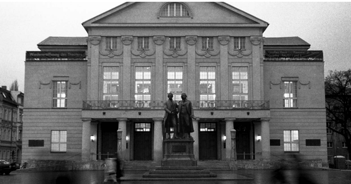
Deutsches National Theater Weimar