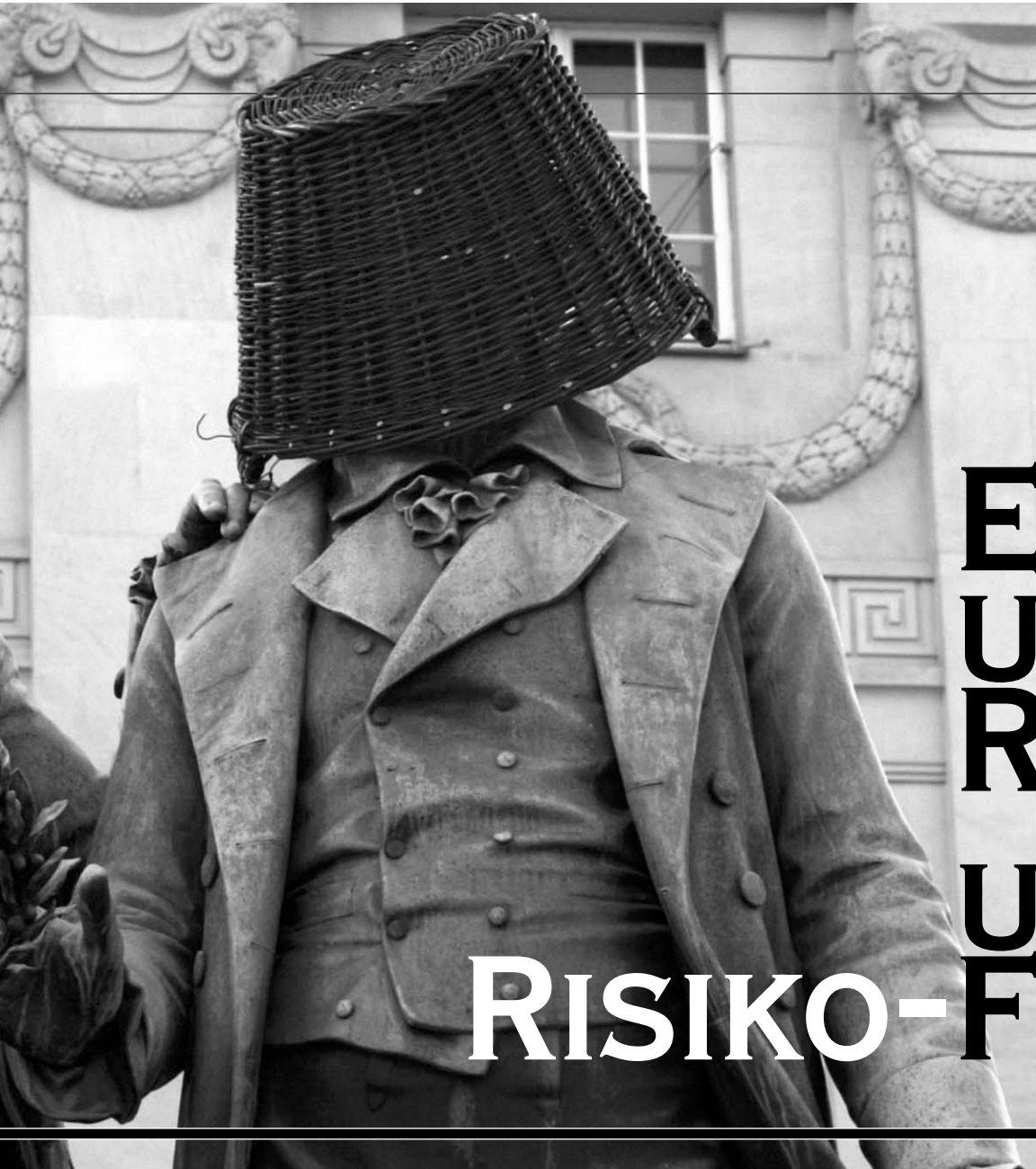
Klassiker, vor der Erleuchtung